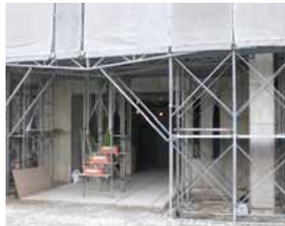
エントランス部分 (H20.11.28 撮影) 木村 典生 (26)