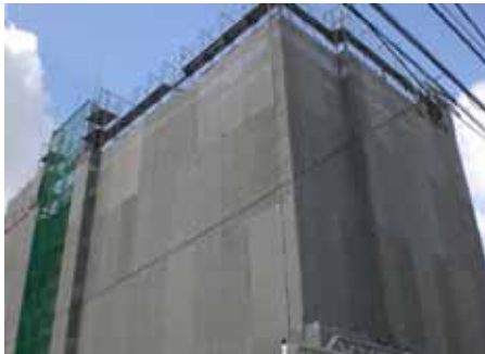
工事状況・南面 (H20.11.28 撮影)