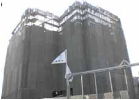
工事状況・北面 (H20.11.28 撮影)

『グランディアガーデンプレイス』は、来年8月末の完成に向けまして順調に工事が進捗しております。着工時は近接する余土小・中学校で卒業と入学のシーズンを迎えておりましたが、基礎工事に始まり現在は6階迄のコンクリート打設が完了されました。12月の工事状況としまして、躯体工事では7～8階の土間（床スラブ）のコンクリート打設工事が、内装工事では3～5階部分で間仕切壁の工事が、外装工事では下層階よりタイル張り等が行われる予定です。これから冬本番を迎えますので、施工の西松建設さんをはじめ現場に携わる方々は大変だと思いますが、販工が共に協力をして施工管理に努めて参ります。